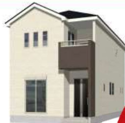
1号棟完成イメージ (現況と異なる場合がございます)

土地面積: 120.31㎡ (約36.39坪) 建物面積: 108.96㎡ (約32.95坪) 建築確認番号: 第R05SHC118264号