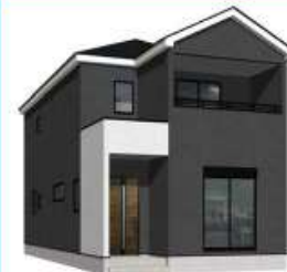
2号棟完成イメージ (現況と異なる場合がございます)

土地面積: 139.06㎡ (約42.06坪) 建物面積: 110.96㎡ (約33.56坪) 建築確認番号: 第R05SHC118265号